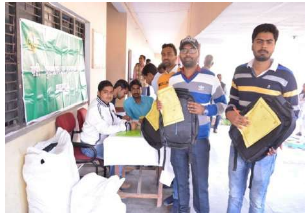
Registration of stakeholders of Training