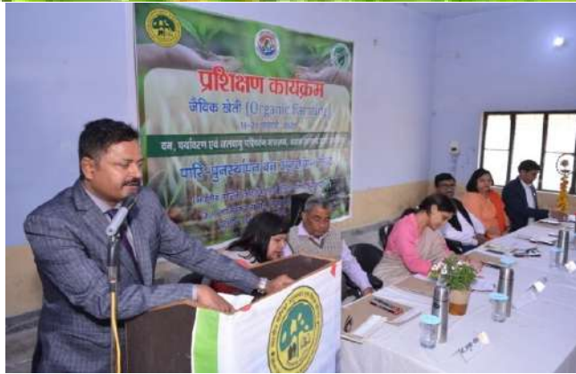
Welcome address by Head, FRCER