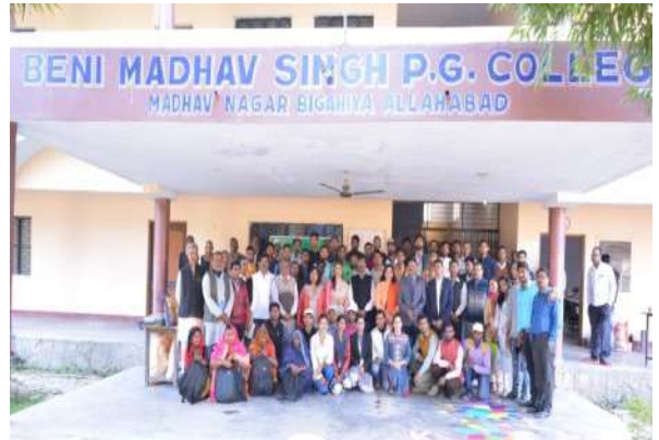
Inaugural Group Photograph