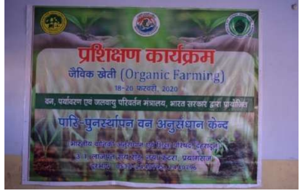
Venue of training at village Madhavpur, Bhegaya