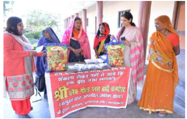
Information about Vermicomposting to farmers in Stall