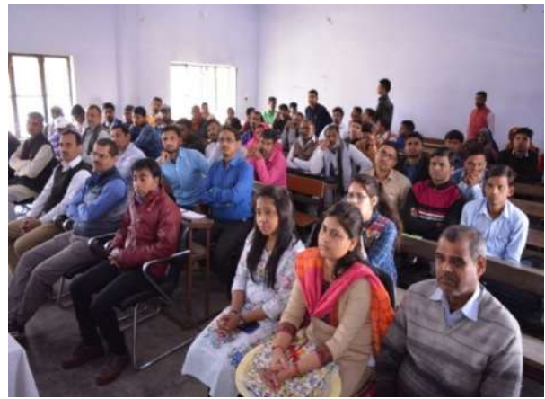
Participants of Training program