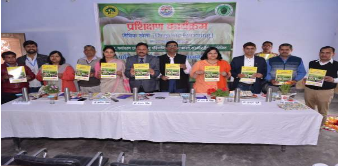
Release of Technical Manual of Training