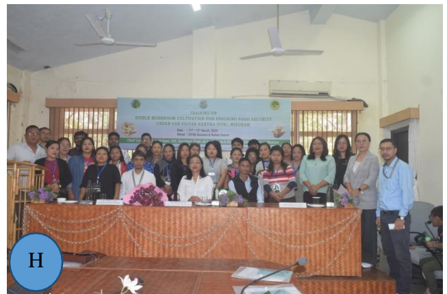
Figure 1: A- B: Welcoming & Felicitating of the Guests; C & D: Address by the Director; E & F: Address by the Guests; G: Vote of thanks; H: Group photo.