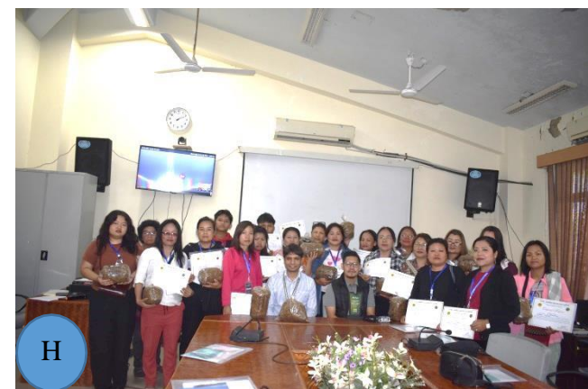
Figure 3: A-H: Distribution of Certificates