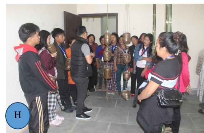
Figure 2: A-H: Glimpses of the training.