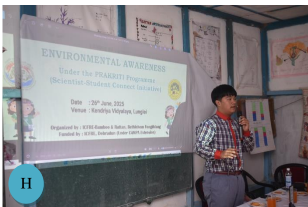
Figure 1: A: Welcome address by the Principal; B: Felicitation of the Principal; C-D: Presentation by Head, ICFRE-BRC; E-H: Showing of documentaries, Interactive session