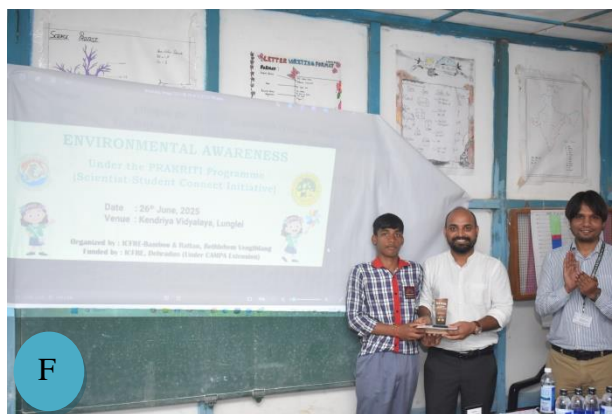
Figure 2: A-F: Quiz Competition and Prize Distribution